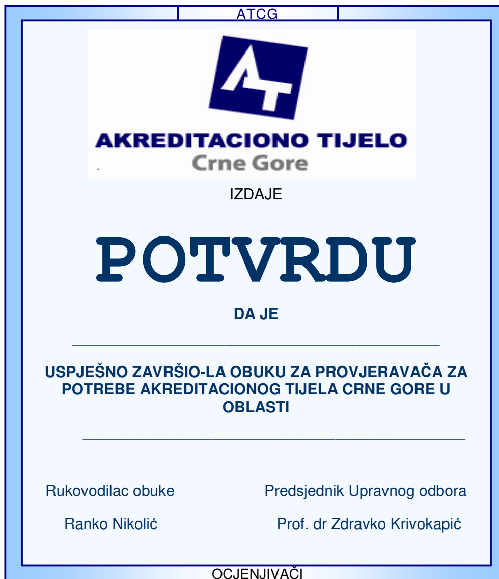
Prilog 2: Izgled legitimacije ocjenjivača